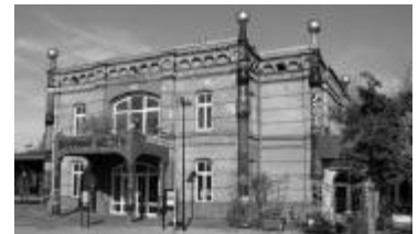
Hundertwasser-Bahnhof in Uelzen

Bitte merken Sie sich bereits jetzt diesen Termin vor, er liegt am Ende der Sommerferien. Veranstaltungsort ist die Hansestadt Uelzen. Die Einladung geht Ihnen rechtzeitig zu, kann aber bereits jetzt online eingesehen werden: www.vdmdbb.de/termine.htm